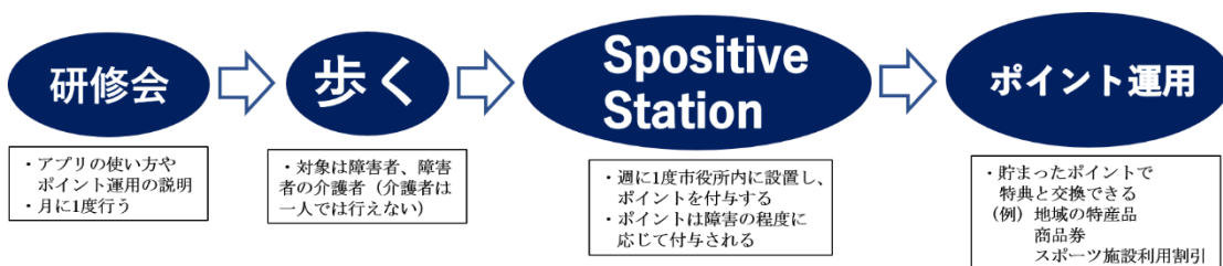
(図2) 「Spositive Walking」の流れ

市区町村の福祉課とスポーツ課が連携し事業費はその予算から捻出する。また、特産品を扱う農家などと契約し支援金を受ける。